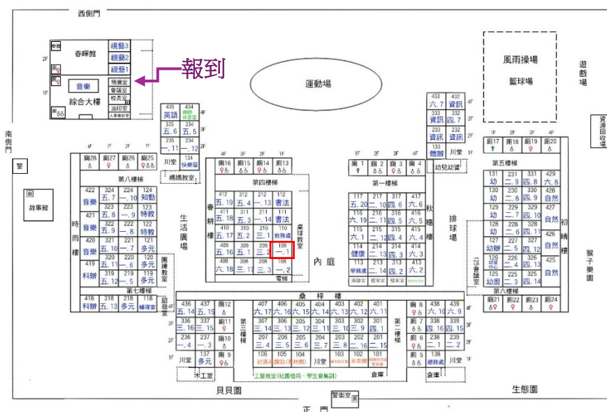
新北市板橋區莒光國民小學 114 學年度教室編號位置圖